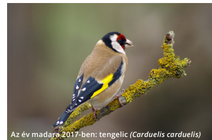
Az év madara 2017-ben: tengelic ( Carduelis carduelis )

Október 1. IDŐSEK VILÁGNAPJA A PINTÉR-KERT ARBORÉTUMBAN Helyszín, időpont: Pécs, Pintér-kert Arborétum, 10.00 és 14.00 óra