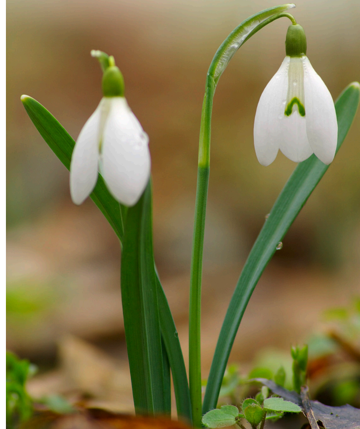
Az év vadvirága 2017-ben: Hóvirág ( Galanthus nivalis )