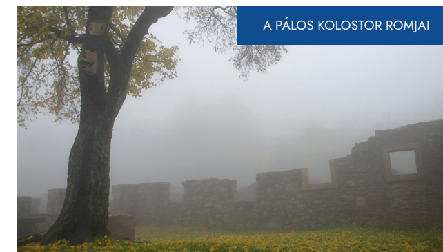
A PÁLOS KOLOSTOR ROMJAI

A Nyugat-Mecsek a különböző történelmi korokban számos népcsoportnak adott otthont. A Dél-Dunántúlról szigetszerűen kiemelkedő hegyek biztos pontot jelentettek a korai népeknek, ahol településeiket, váraikat felépíthették. I. e. 800 körül a Jakab-hegyen létesítették földvárukat az illírek. A földvár sáncainak maradványa most is meghatározó tájképi eleme a tájnak. Monumentalitása lenyűgöző, mérete Közép-Európa legnagyobb földvárává teszi. A mellette elterülő halomsírmező őrzi a majd háromezer éve elhunyt építők emlékét. A Misina északi oldala alatt megbújó Kantavár hozzá képest csekély rom csupán. A feltehetőleg a 13. században épült várnak ma már apró falrészletei látszanak csak. Nem úgy a pálos kolostornak a romja, mely a Jakab-hegy fennsíkján található. A 13. századtól folyamatosan épülő szentély az egyetlen magyar alapítású szerzetesrend kiindulópontja volt. Az egykori kolostor jelenlegi állapotában is látványosan mesél az egykor itt élt pálos szerzetesek életéről. A falak legutolsó állagmegóvása 2019-ben fejeződött be, gondoskodva arról, hogy a kolostor még sokáig tanúskodjon a rend kezdeti éveiről. A pálos rendnek újkori hagyatéka is megtalálható a Jakab-hegyen. 1947-ben a kolostor mellett egy „új templom” építésébe fogtak, melyet a történelem alakulása miatt befejezni nem tudtak. Az épület ma a kirándulóközönséget szolgálja, felújítási munkálatai 2021-ben fejeződtek be.