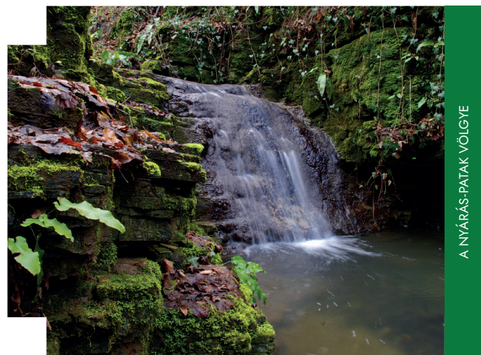
A NYÁRÁS-PATAK VÖLGYE

A Tájvédelmi Körzet jelentős részén megfigyelhető a karsztosodás folyamata. A hegyek északi lejtőin az erdők talaját sok helyen töbrök, dolinák szabdalják, a patakok pedig mély szurdokokba vájva, sok helyen látvá-