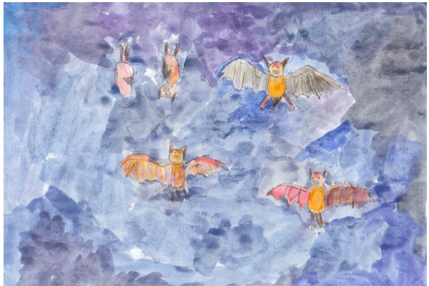
Kováts Levente Ákos alkotása

A pályázatra beérkezett alkotások megtekinthetők a Duna-Dráva Nemzeti Park Igazgatóság fotóalbumában, ide kattintva: https://www.flickr.com/photos/dunadrava/albums/72157714032452617