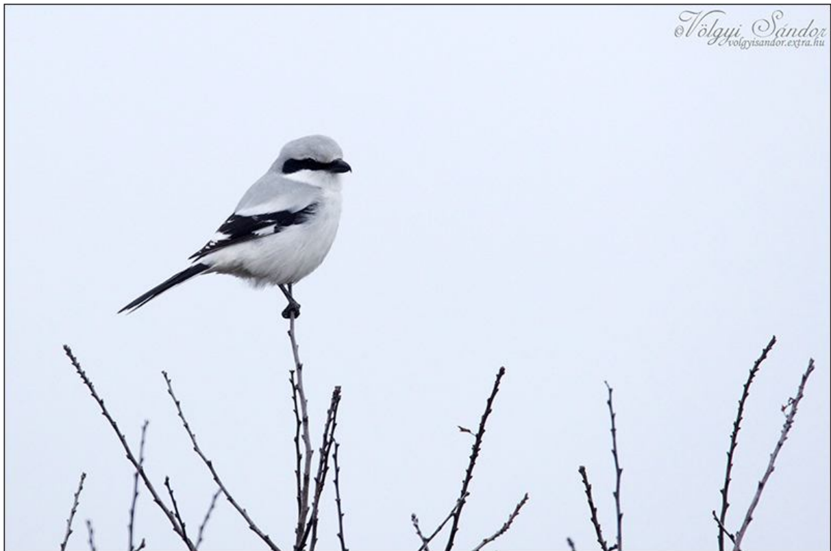
Szöveg és fotó: Völgyi Sándor

A nagy őrgébics ( Lanius excubitor ) Magyarországon védett faj, természetvédelmi értéke 50 000 Ft.