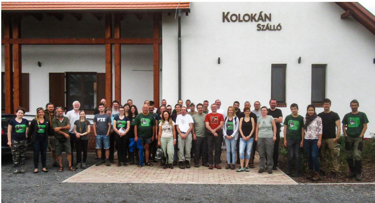
A találkozó résztvevői.

A háromnapos esemény előadásain többek között szó esett ritka és különleges fajok megfigyeléseiről, a Duna-Dráva Nemzeti Park Igazgatóság működési területének értékes lepke-élőhelyeiről, a keresőkutyák lepkekutatásban történő alkalmazásáról, továbbá a különböző terepi adatgyűjtő technikák és módszerek használatának tapasztalatairól. A résztvevők meglátogatták a közeli Villányi-hegységet és annak legmagasabb régióját, a Szársomlyót is.