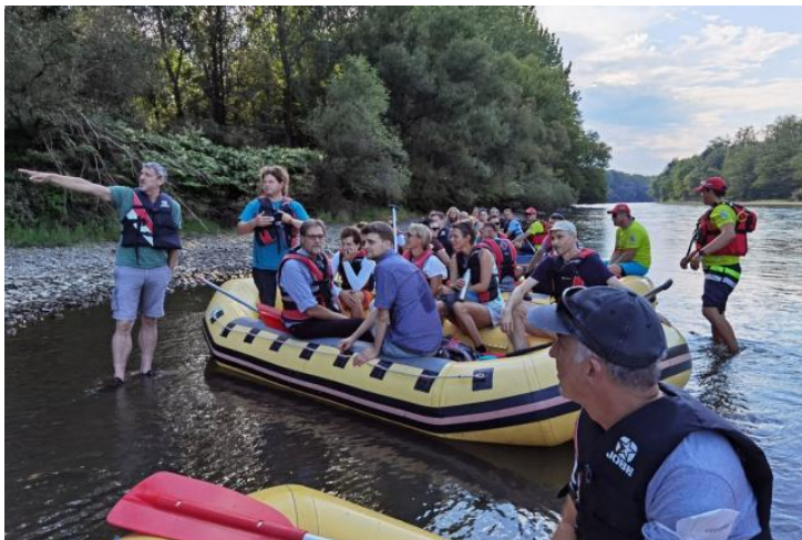
A tanulmányút egyik pillanata

A Lifeline MDD Interreg projekt keretében a szlovéniai Gornja Radogna és az ausztriai Bad Radkesburg városokban egy nemzetközi konferencia került megszervezésre, mely elsősorban azt szolgálta, hogy az öt országban dolgozó természetvédelmi szervezetek jobban megismerhessék egymás tevékenységét és megtalálják azokat a közös pontokat, ahol együttes erővel lehet tenni a természeti értékek megőrzéséért.