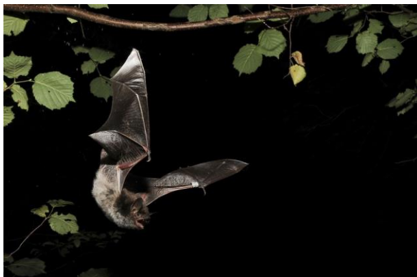
Tavi denevér

A párzás ősszel megtörténik, de a magzat fejlődése a téli álmot követően indul meg. Az egy, esetleg kettő kölyök május végén, június elején születik meg a nyári szálláshelyen, és egy hónap után lesz önálló.