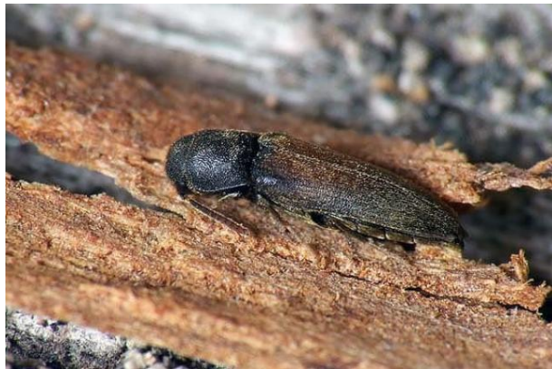
Kétszínű tövisnyakúbogár

Magyarországon biztosan a Kőszegi-hegységből és a Dunántúli-középhegységből – Bakony, Budai-hegység – ismert. Van azonban egy megerősítendő lelőhelyadata a Somogyi-dombság területéről, Siófokról is. Bomló növényi anyagokban, avarban, korhadt fákban, kövek, fadarabok alatt él.